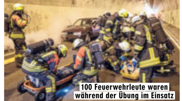
100 Feuerwehrleute waren während der Übung im Einsatz

Von J. SCHÜMANN – Schreckens-Szenario am Samstag im Autobahntunnel