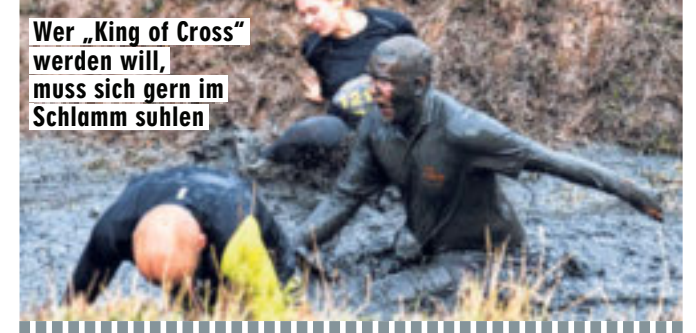
Wer „King of Cross“ werden will, muss sich gern im Schlamm suhlen